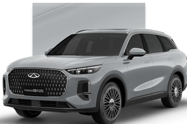
Tech Gray (GXM)